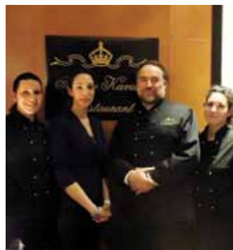
Az Arany Kaviár csapata

Több éve a Hotel Intercontinental Budapest ad otthont a budapesti vendéglátás, gasztronómia, szálloda és egyéb szolgáltatóipar díjkiosztó gálájának a Best of Budapest Publishing rendezésében, így idén március utolsó szombatján, március 26-án sem volt ez másképp. A 2010. évi teljesítmények alapján csaknem hatvan kategóriában osztottak díjat, majd exkluzív ételkóstoló következett A város ízei néven, a legjobb fővárosi gasztronómiai helyek – éttermek, kávéházak – részvételével. Képesszálításunk az elegáns díjkiosztó est alkalmával készült.